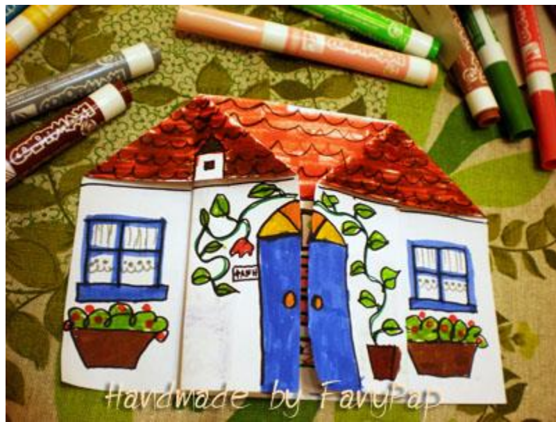
Handmade by FanyPap