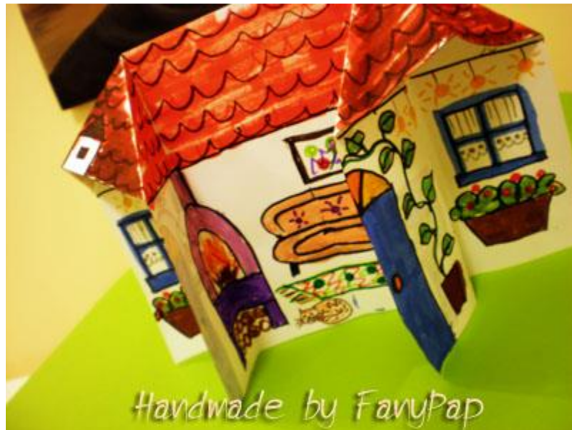
Handmade by FanyPap